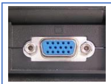
Bilde 1. VGA-inngang

Ved bruk av to skjermer kan elev og testleder se det samme Logos-bildet på skjermen samtidig. For å koble til en ekstra skjerm til testpc-en, trenger du to ting: