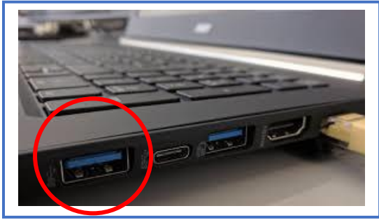
Bilde 3. USB-port

Ekstra skjerm og en kabel. Eldre PC-er har gjerne en VGA-inngang (bilde 1), mens nyere PC-er oftest har HDMI-port (bilde 2). De aller slankeste bærbare PC-ene har noen ganger kun USB-port (bilde 3). Sjekk hvilken type port/inngang du har på pc-en din og hvilken utgang det er på skjermen. Om du ikke har en passende kabel må du gå til anskaffelse av en. Det er også mulig å bruke en overgang dersom du har en kabel med f.eks. VGA-kontakt mens pc-en har HDMI- eller USB-port.