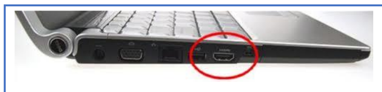
Bilde 2. HDMI-port