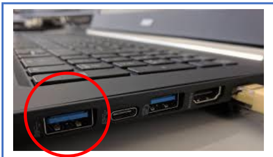
Bilde 3. USB-port

Ekstra skjerm og en kabel. Eldre PC-er har gjerne en VGA-inngang (bilde 1), mens nyere PC-er oftest har HDMI-port (bilde 2). De aller slankeste bærbare PC-ene har noen ganger kun USB-port (bilde 3). Sjekk hvilken type port/inngang du har på pc-en din og hvilken utgang det er på skjermen. Om du ikke har en passende kabel må du gå til anskaffelse av en. Det er også mulig å bruke en overgang dersom du har en kabel med f.eks. VGA-kontakt mens pc-en har HDMI- eller USB-port.