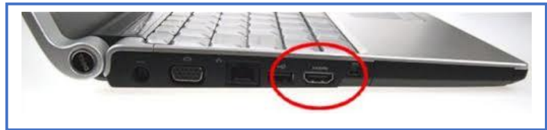
Bilde 2. HDMI-port