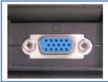
Bilde 1. VGA-inngang

Ved bruk av to skjermer kan elev og testleder se det samme Logos-bildet på skjermen samtidig. For å koble til en ekstra skjerm til testpc-en, trenger du to ting: